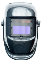
Vidrio de soldador