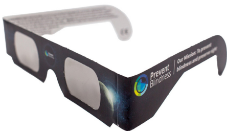
Gafas de eclipse solar